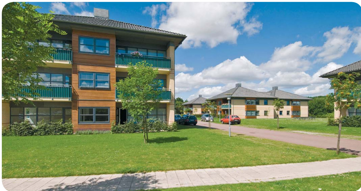
Du kan se og læse om Pensionskassens forskellige ejendomme på hjemmesiden.

Her kan du også printe et ansøgningsskema ud, som udfyldes og sendes til Pensionskassen.